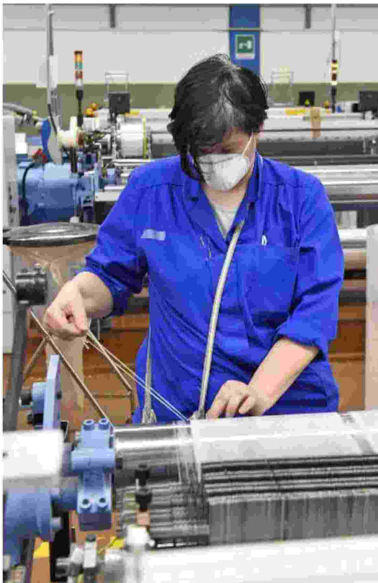
Nelle grandi aziende a capitale cinese la manodopera pagata in base alla nazionalità

«Abbiamo creato un sistema di accompagnamento per le vittime di sfruttamento e negli ultimi due anni abbiamo gestito un centinaio di singoli casi. Solo dove c'erano le condizioni siamo andati avanti con la denuncia»